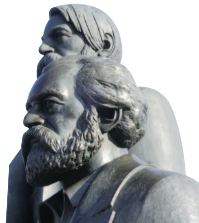
Estatua de Marx y Engels, centro histórico de Berlín.